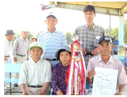
準優勝 宮迫八幡チーム