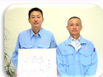
安井プラスチック 株式会社