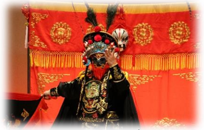
ミスターシュガー