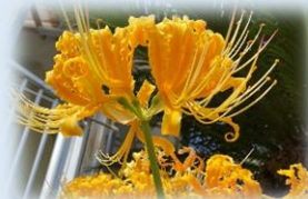
ショウキズイセン（肝煎一区）