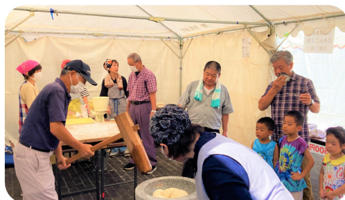
民生児童委員さんのもち搗き。汗びっしょりです。