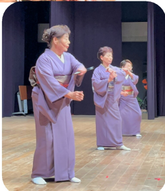
にじの会の 優美高妙な舞い☆