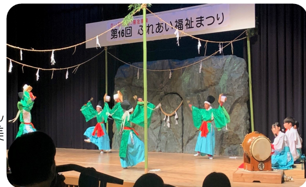
取りは清川子ども神楽。10名で手散米を披露。