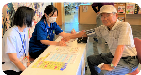
保健師さんと包括ランチによる 健康チェック・福祉コーナー。