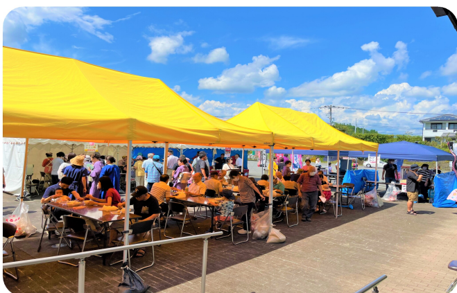
お昼時はどのお店も行列ができていました。