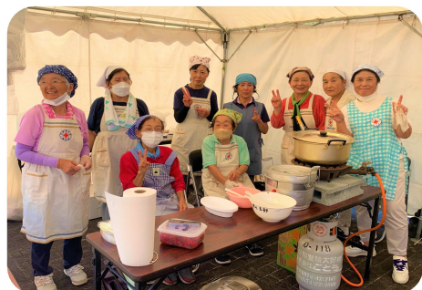
日赤奉仕団はカレーを担当。