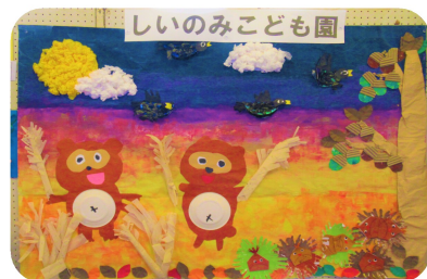
町内福祉施設の利用者さんや保育園 の園児のみなさんによる夏秋の季節 を感じる作品がいっぱいでした。