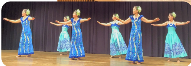
フラダンス。色とりどりの衣装が素敵でした☆