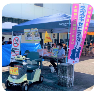
セニアカーの試乗体験。