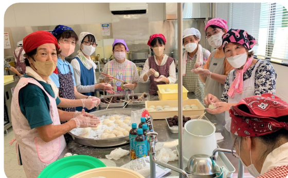
もち作りは福祉委員さんにもご協力いただきました。