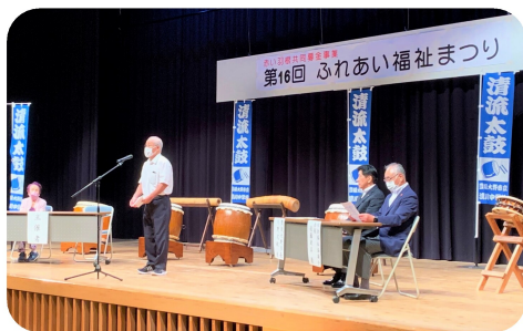
地区社協会長、来賓よりごあいさつ。