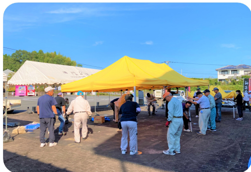
区長さんやボランティアの方々が準備をしてくださいました。

コロナ禍でずっと延期になっていましたが、9月10日、4年ぶりに開催することができました。神楽会館ステージでは、清川中の清流太鼓から始まり、舞踊や神楽など、7団体に出演いただきました。ロビーでは、市内の福祉施設等の作品展示や各種体験コーナー、屋外では、搗き餅やカレー、豚汁などの模擬店が並びました。天気予報は曇り☁️や雨🌧️でしたが、朝から快晴☀️ みなさんの思いが通じ、最後まで大賑わいの福祉まつりでした。