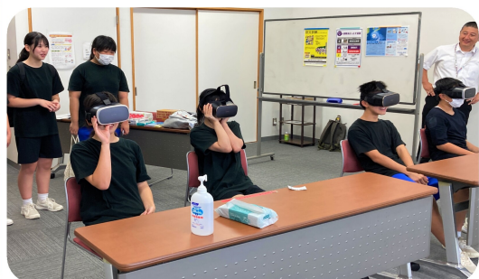
専用のゴーグルを着け災害を立体的 に体験。あちこちで叫び声が…。