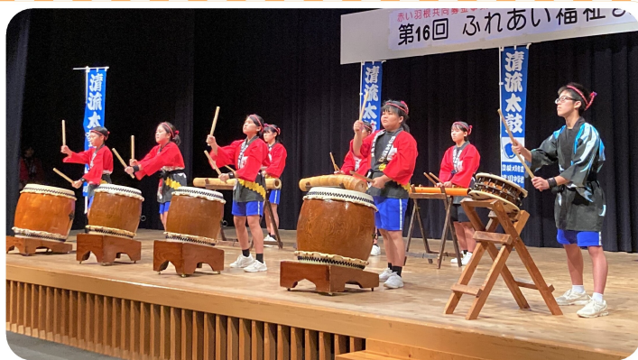
清川中清流太鼓の勇壮な響きでステージ開幕！