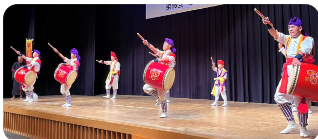
沖縄エイサー。実は社協職員が4人いました。