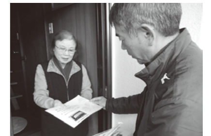
(犬飼地区社協・鶏飯配布)