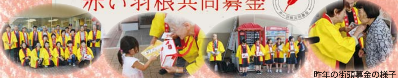
昨年の街頭募金の様子