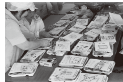
(すみれ会・ふれあい訪問給食)