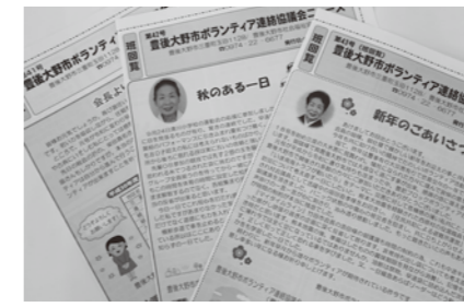
(豊後大野市ボランティア連絡協議会・ニュース発行事業)